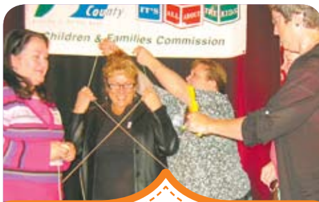
Todas enredadas en la demostración del hilo dental humano

El evento presentó a expertos locales de la salud oral y actividades divertidas que los participantes podían llevar a los niños que están a su cuidado para promover la buena salud oral. La conferencia también incluyó talleres en cómo mejorar la comunicación entre los niños y sus padres y el cómo establecer metas profesionales y personales.